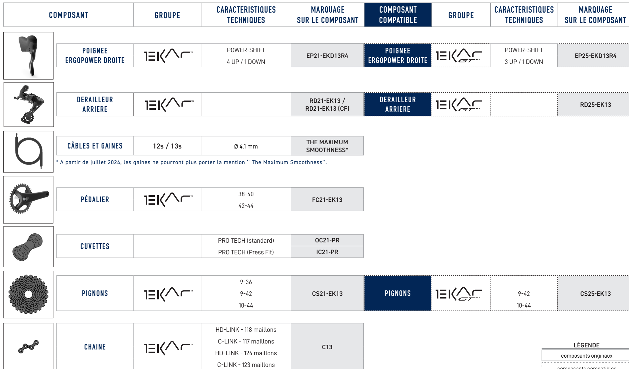
TABLEAU DE COMPATIBILITE GROUPE EKAR