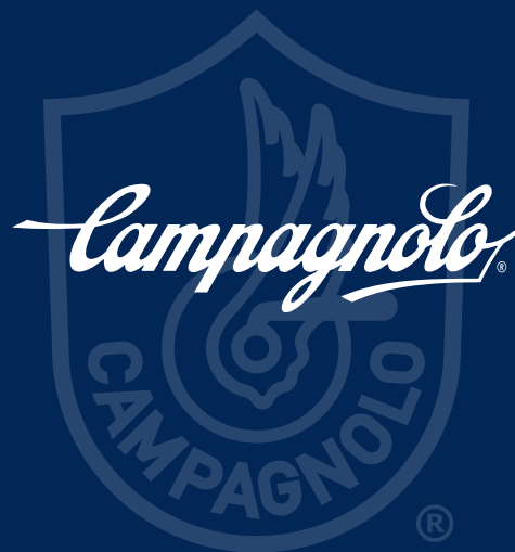
TABLEAU DE COMPATIBILITE GROUPE EKAR