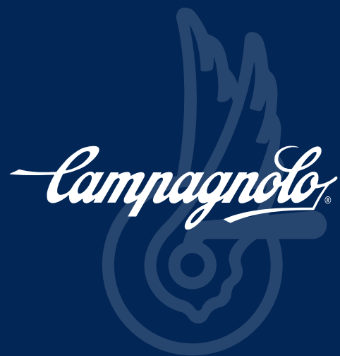
TABLA DE COMPATIBILIDAD RUEDAS CON CUERPO DE RUEDA LIBRE N3W CAMPAGNOLO (11s-12s-13s)